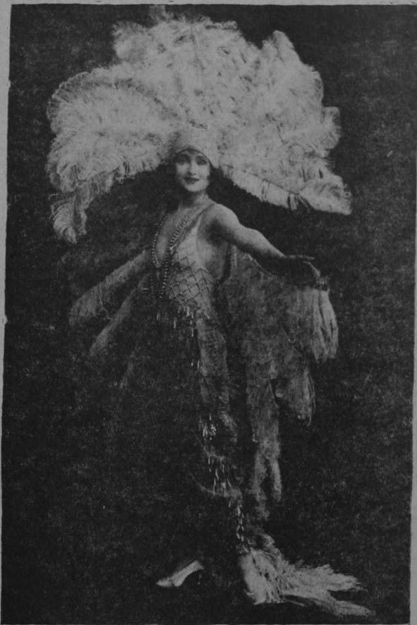
Interpreta Bouclette Domingo 10 en el Teatro América